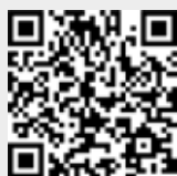
TAVOLA SERIE TV