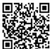
TAVOLA SERIE TPGA